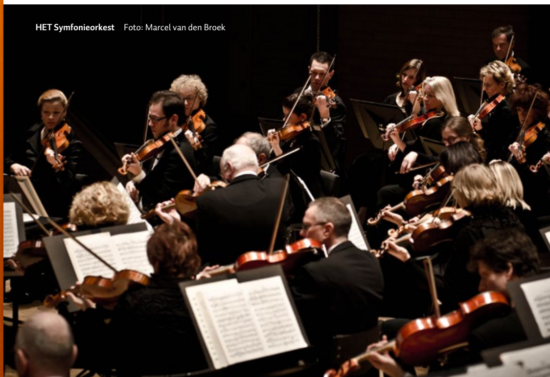
HET Symfonieorkest